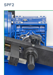
SKIVING MANDREL MANDRINO SPELLATURA