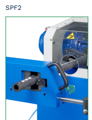
OPTIONAL PNEUMO-HYDRAULIC VICE MORSA PNEUMO-IDRAULICA