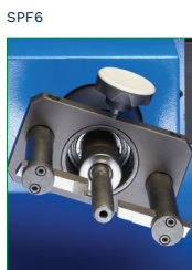
SKIVING MANDREL MANDRINO SPELLATURA