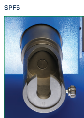
INSERT MANDREL MANDRINO INSERITORE