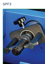
SKIVING MANDREL MANDRINO SPELLATURA